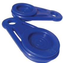
Rögzítő műanyag fül