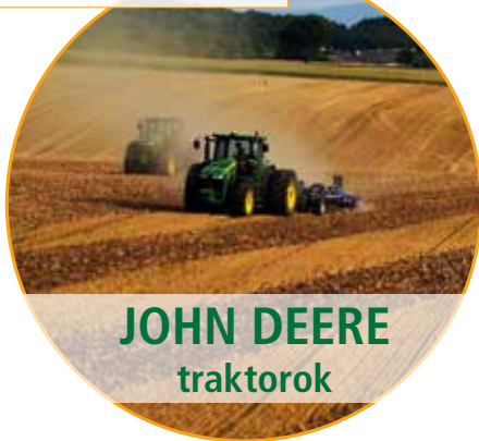
JOHN DEERE traktorok