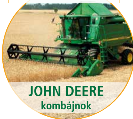
JOHN DEERE kombájnok