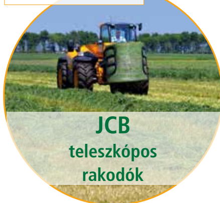
JCB teleszkópos rakodók