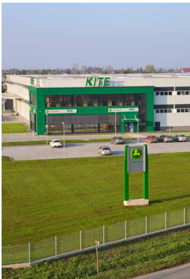
Az új KITE logisztikai központ 7400 m 2 -es raktárterülettel

A különböző agronómiai szezonokban alkatrész-ellátási ügyeletet biztosítunk a partnereink számára, hogy a megrendelt alkatrészt minél gyorsabban eljuttassuk a meghibásodott géphez – legyen az akár a szántóföldön. Igény esetén, szervizszerelőink kiszállítják az alkatrészt, és szakszerűen garanciával javítják a meghibásodott gépet.